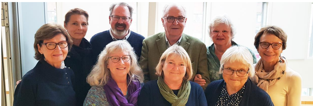
Sykehusets Brukerutvalg 2024.